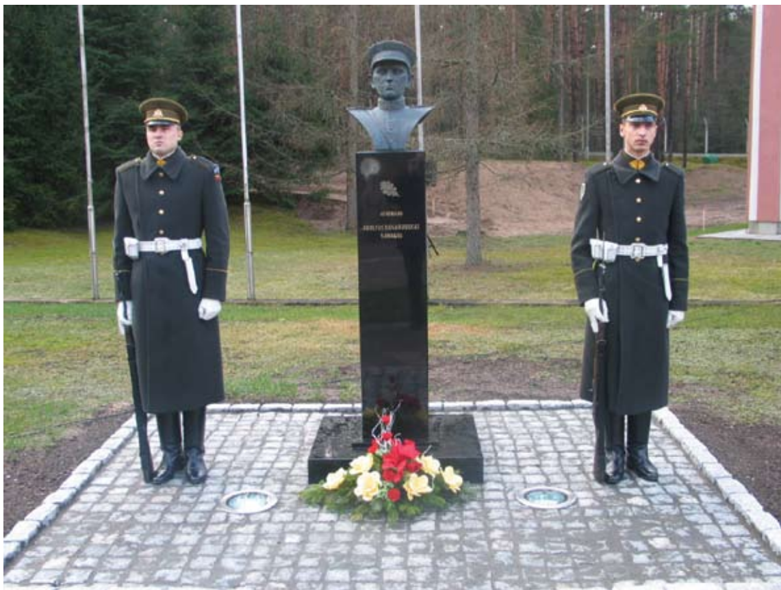
Per kiekvieną šventę atiduodama pagarba generolui Adolfui Ramanauskui-Vanagai.

– Yra suformuluota užduotis reformuoti centrą, tačiau nėra suformuluotos centro užduotys po reformavimo. O tai reiškia, kad mes nežinome galutinio tikslo, kurio siekiame. Todėl esu įsitikinęs, kad prie šio klausimo dar teks sugrįžti, diskutuoti įvairiais lygiais ir ieškoti to optimalaus varianto iš naujo. Bet viena žinau – jau galima teigti, kad viena iš būsimo centro užduočių bus sudaryti sąlygas vykdyti ne tik bataliono lygmens ir masto, bet ir brigados lygmens vienetų jungtinius mokymus, panau-