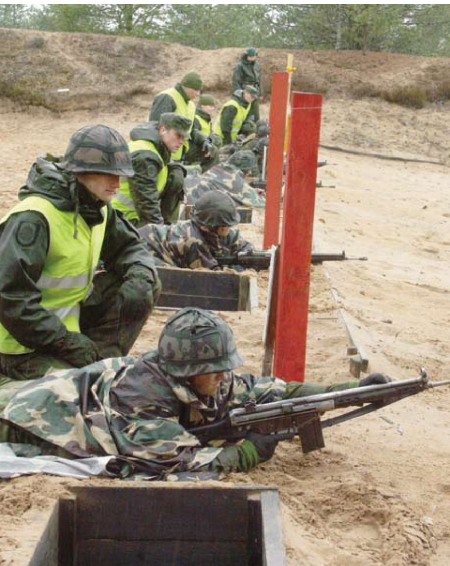
Šaudykloje civilius prižiūri tikrieji kariūnai.

Paskelbtas aliarmas – kai kam net karas pasivaideno, juo labiau kai apsimiegojusiems prieš akis išdygo kariūnai, išsigražinę karišku makiažu. Ne visi suspėjo nusiprausti ar iki galo susitvarkyti – teko išklaustyti kovinį įsakymą ir skubiai vykti į Centrinį poligoną.