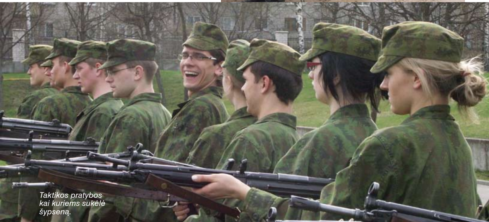
Taktikos pratybos kai kuriems sukėlė šypseną.