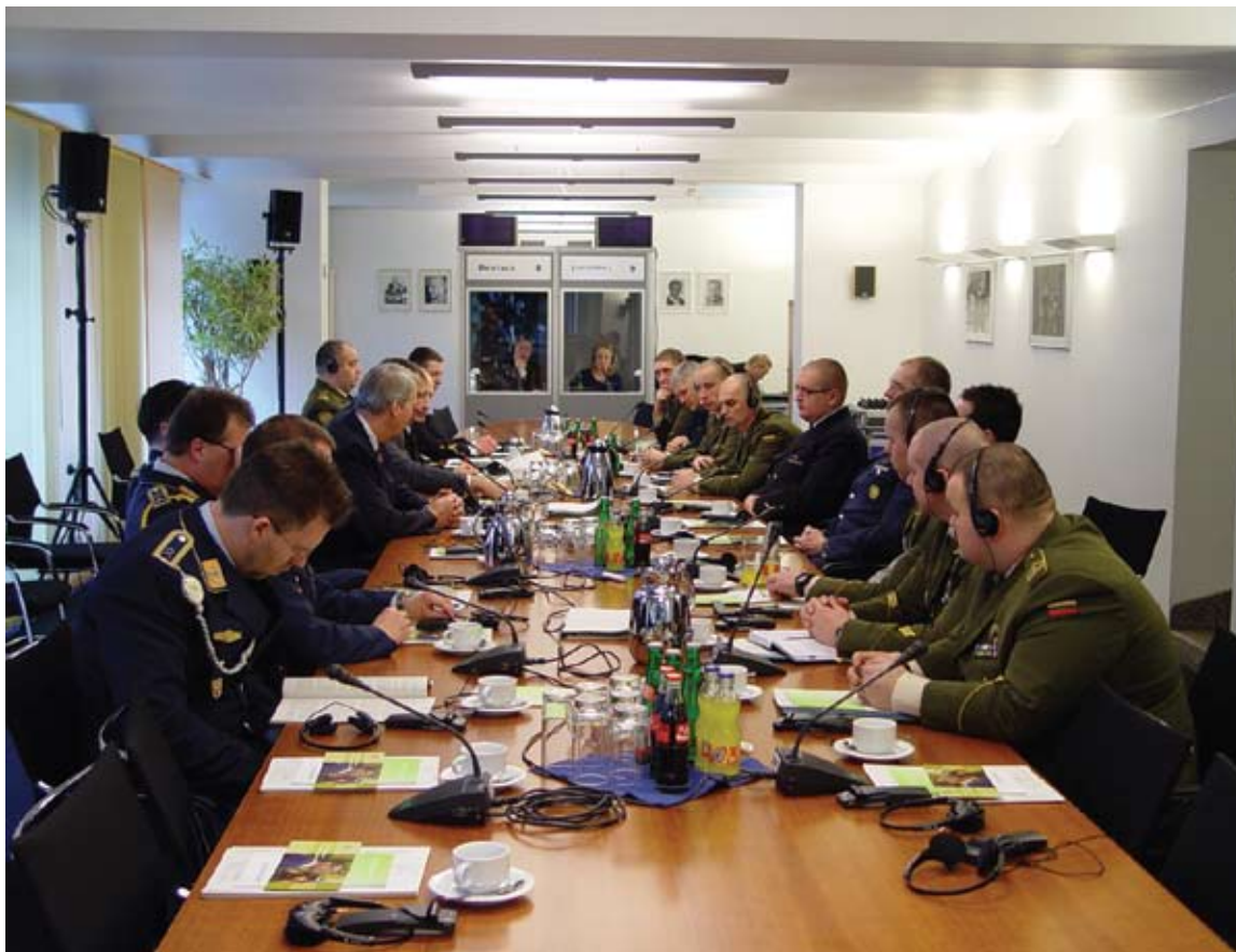
Susitikimas su parlamento igaliotiniu Vokietijos ginkluotosioms pajėgoms.

ir vadų nusiskundimai. Taip pat susitikome su vokiečių karių profesinės sąjungos atstovais, jie papasakojo, kaip yra atstovaujama karių interesams, susijusiems su socialinėmis garantijomis, darbo užmokesčiu ir kitais visuomeninio gyvenimo dalykais.