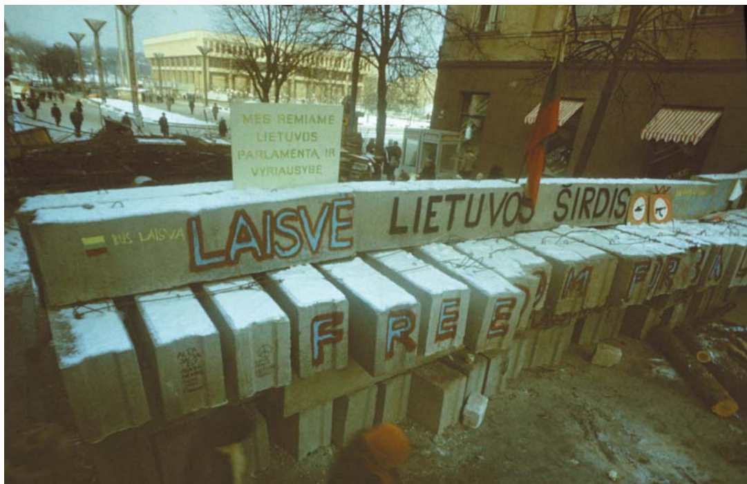
Atmintinos barikados Gedimino prospekte.