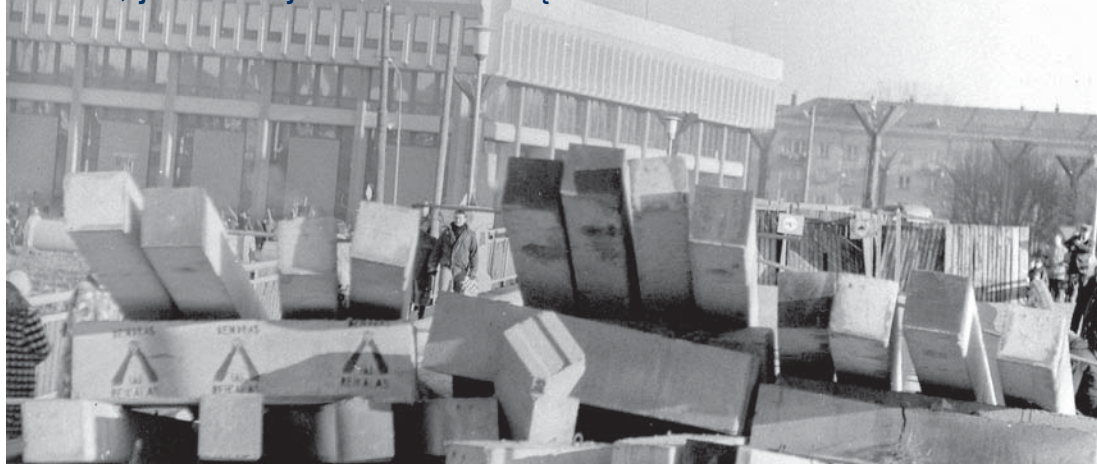
Neįprastos gelžbetonio konstrukcijos blokavo privažiavimą prie Aukščiausiosios Tarybos (dabartinio Seimo) rūmų.

1991 m. sausį Vilniaus barikadose buvo sukloti ir sumontuoti apie 300 m 3 gelžbetonio ir betono blokų, per 150 tonų metalo konstrukcijų; 180–220 m 3 akmens riedulių, iškastas prieštankinis 250 m ilgio, 3 m gylio ir 6 m pločio griovys, palei Neries upę ant takų ir šlaito sumontuota apie 200 m gelžbetoninių vamzdžių, paklota 8 t spygliuotos ir 2 t plieninės vielos, 300 m 2 žvejų tinklo. Barikadų statyba kainavo 105 223 rublius, jos stovėjo iki 1993 metų rudens.