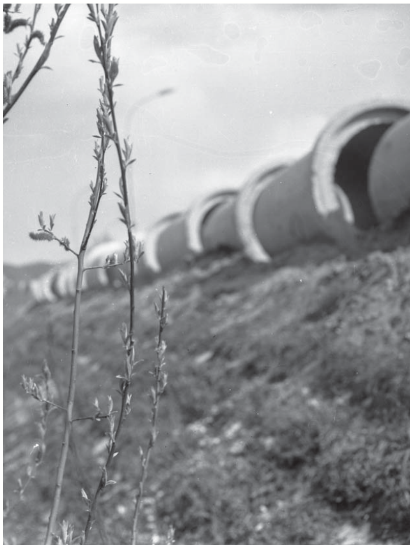
Neries krantinė prie Parlamento buvo apjuosta sutvirtintais rentiniais.