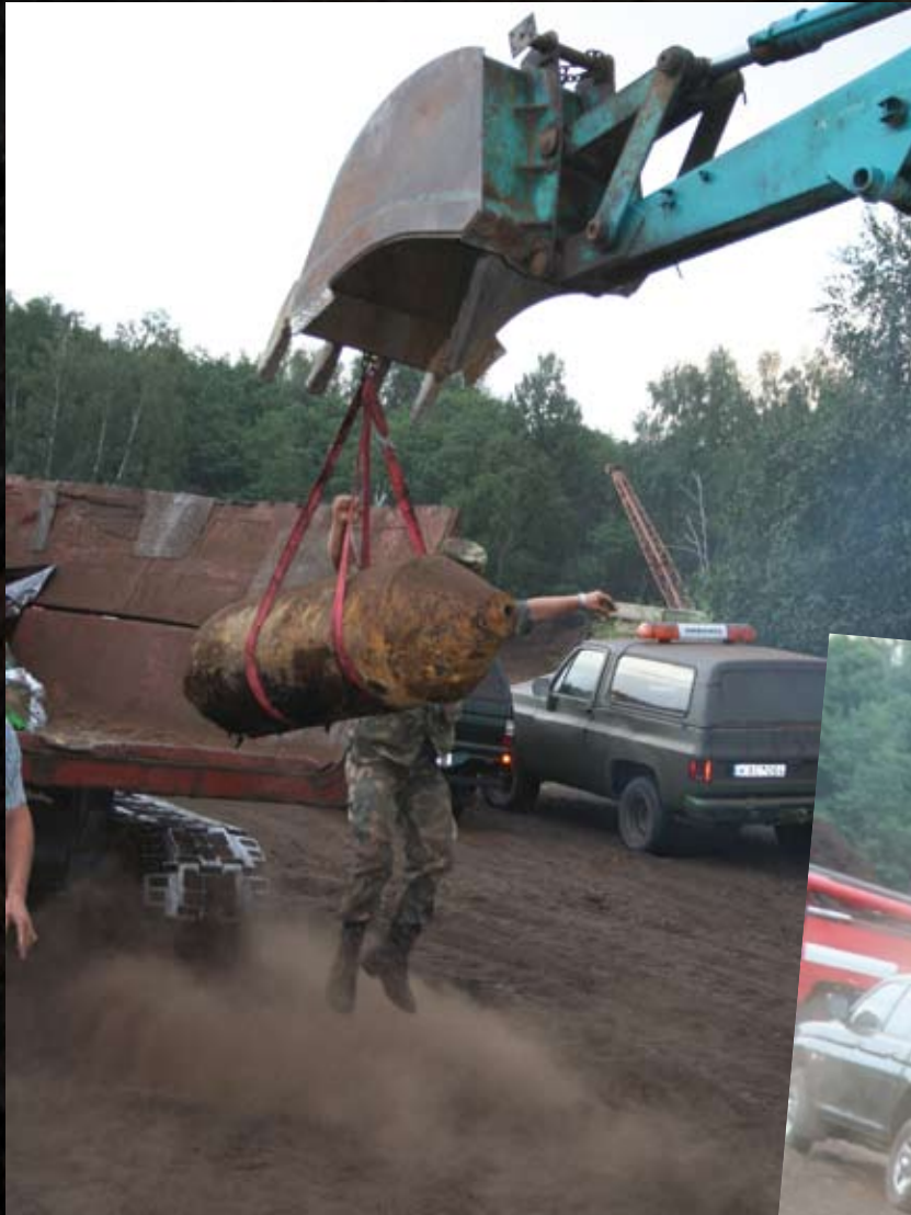
Išminavimo skyriaus kariai bombų neutralizavimo metu.

buvusiam kariūnui, puikiai pažįstama. Granata buvo nepavojinga – išminuotojai ją išgabeno ir sunaikino.