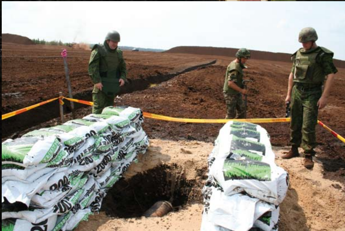
Išminuotojų kostiumu pasipuošęs srž. Mindaugas Petronaitis.