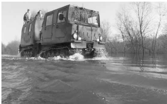
Praėjusiais metais potvynio metu kariai gyventojus gelbėjo švediškais transporteriais

Kaip sakė Vakarų karinės apygardos vadai, periodinio vandens pakilimo metu užliejama apie 40 tūkst. hektarų zona, kurioje gyvena per 4 tūkst. gyventojų. Šioje vietovėje įsikūrę 37 gyvenvietės ir kaimai, 720 vienkiemių.