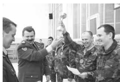
Nugalėtojams įteikiami apdovanojimai.

2003 01 29 Karo akademijos sporto bazėje vyko 6-ųjų Krašto apsaugos