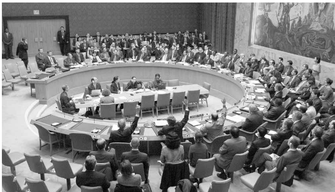
2002 11 08 Jungtinių Tautų Saugumo taryba priėmė rezoliuciją Dėl Irako nuginklavimo Nr. 1441. Rezoliucija išspausdinta 2002 m. leidinyje „Krašto apsauga“ Nr. 23(26).

Dabar leiskite pereiti prie pagrindinio bendradarbiavimo reikalavimo ir Irako reakcijos į jį. Galime teigti, kad bendradarbiavimas yra susijęs tiek su reikalavimu, tiek su procesu. Mūsų patirtis iki šiol liudija, kad Irakas priėmė sprendimą iš esmės bendradarbiauti dėl proceso, ypatingai priėmimo prie objektų suteikimo atžvilgiu. Būtina priimti panašų sprendimą bendradarbiauti dėl reikalavimo, siekiant įgyvendinti nusiginklavimo uždavinį taikaus monitoringo proceso