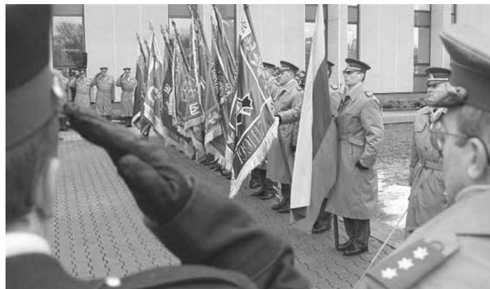
Krašto apsaugos savanorių pajėgų rinktinių vėliavų rikiuotė.

Pagalbos į Nemirsetoje budintį KOP paieškos ir gelbėjimo darbų postą sausio 25 d. vakare kreipėsi Jūrinio paieškos ir gelbėjimo