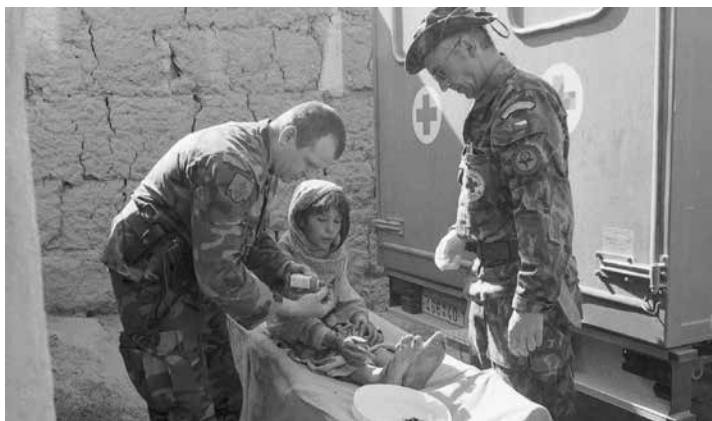
Lietuvos karo medikai misijoje Afganistane.

2003 02 04 Kaune karo medicinos gydytojų kurso baigimo pažymėjimai įteikti antrajai absolventų laidai.