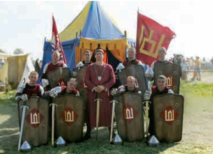
XIV a. Lietuvos kario rekonstrukcija