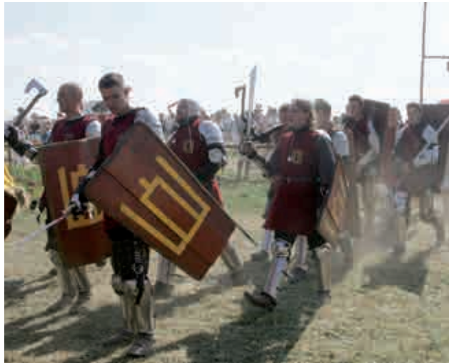
LDK XIV a. karių rekonstruktoriai, minint Žalgirio mūšio 600-ąsias metines