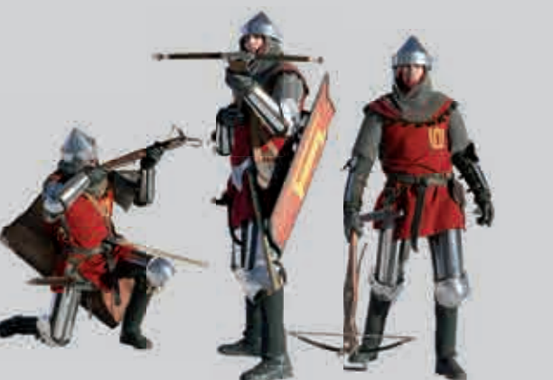
XIV a. Lietuvos kario rekonstrukcija

Leičiai yra itin glaudžiai susiję su Lietuvos, lietuvių vardu ir jų variantais, todėl kad tiesiogiai priklausė valdovo vadovaujamai politinei organizacijai. Tai viena iš vardo Lietuva reikšmių. Leičiai plėtojo ir tvirtino šią organizaciją lietuvių ir gretimose gentyse per valdovo kiemus. Dėl to vardo Lietuva reikšmių buvo ne viena: lietuvių valdovo politinės struktūros pavadinimas, jo kiemų valstybėje vardas, jo kariuinių dalių pavadinimas, jo artimiausių tarnų ir jų tarnybos vardas, viena iš lietuvių genčių žemių, pagaliau ir visos valstybės pavadinimas.