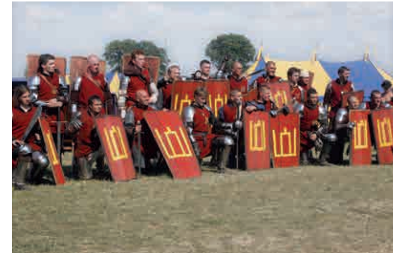
Vėlyvųjų viduramžių rekonstruktorių brolija „Viduramžių pasiuntiniai“