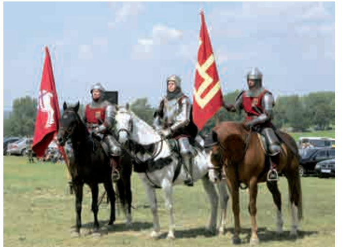
Vytautas Didysis su palyda per Žalgirio mūšio inscenizaciją, minint Žalgirio mūšio 600-ąsias metines