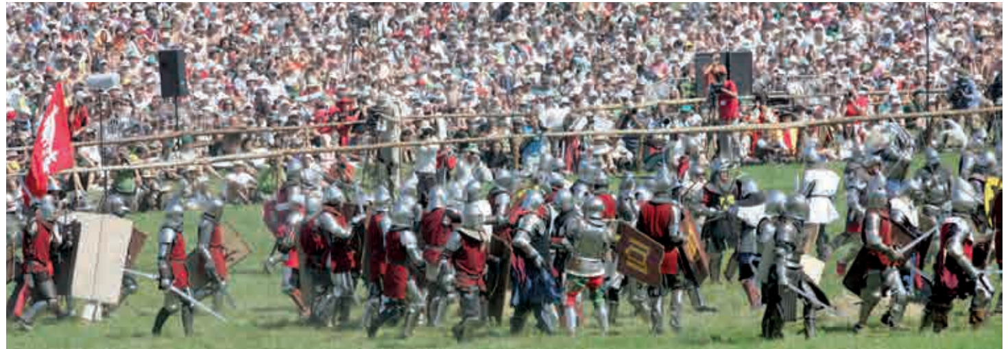
XIV a. Lietuvos karių rekonstruktoriai per Žalgirio mūšio inscenizaciją, minint Žalgirio mūšio 600-ąsias metines