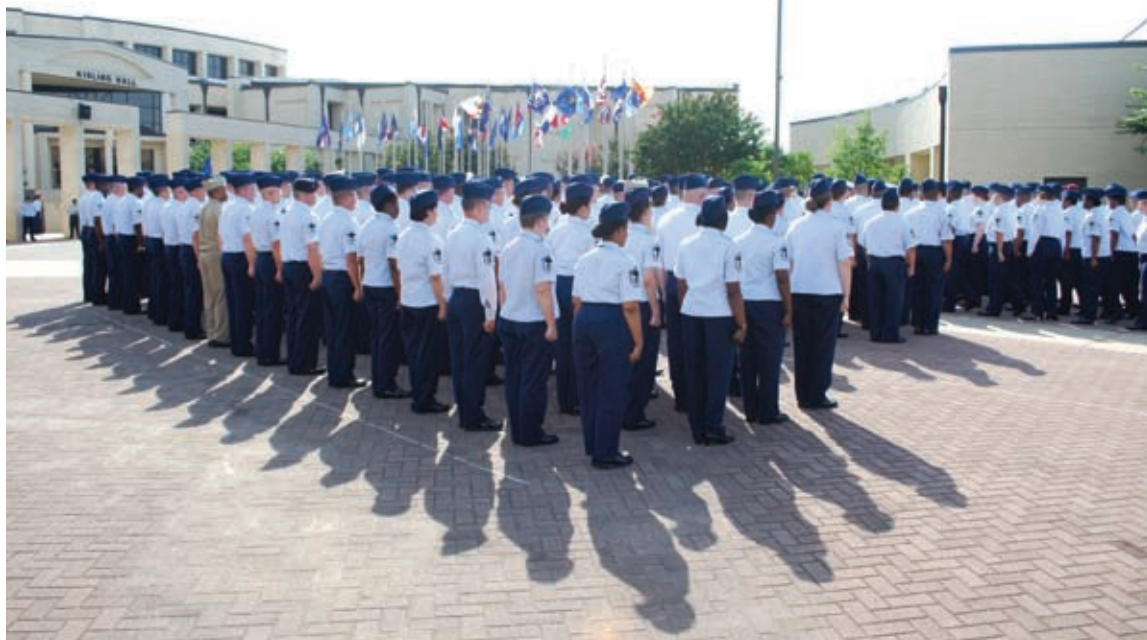
Kursantų rikiuotė prie akademijos.

pagerinti rezultatus – kasdien kartu su instruktoriumi darydavome po keturiasdešimt atspaudimų iš ryto ir tiek pat po pietų.