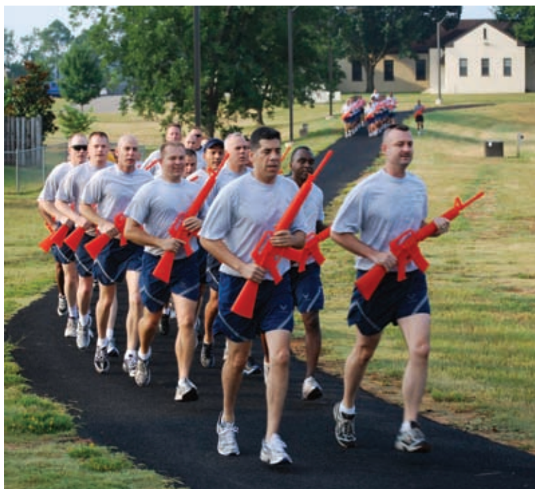
Fizinio lavinimo pratybos su M-16 muliažais.

Labai patiko fizinio lavinimo pratybos – viskas daroma labai metodiškai. Kursų pradžioje instruktoriai surengė pristatymą: paaiškino testų eigą, pratimų atlikimo ir skaičiavimo metodiką, nurodė, kokią aprangą per pratybas gali dėvėti karys, taip pat labai priimtina forma buvo papasakota apie sporto naudą. Testai vyko du kartus